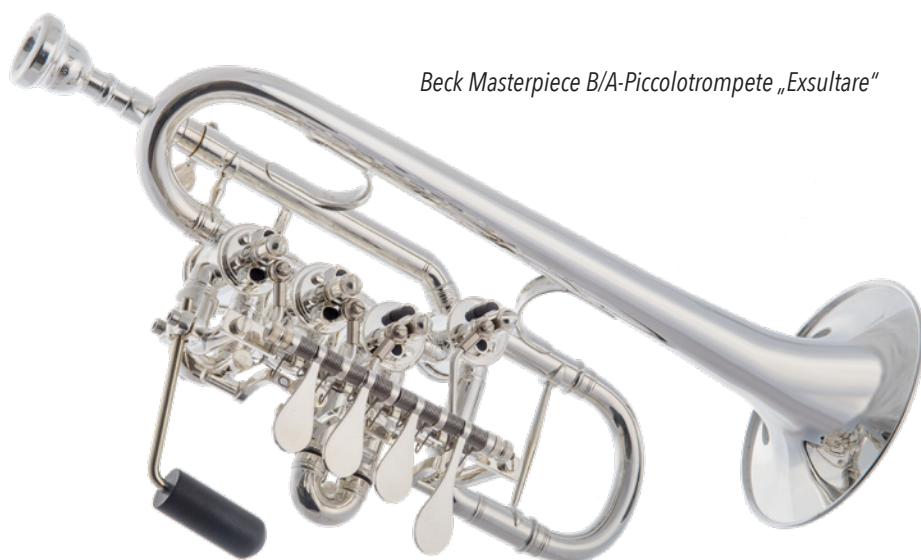
Beck Masterpiece B/A-Piccolotrompete „Exsultare“

Die „Jubilare“ und „Haydn“ sind als Einzelmodell in einer Stimmung bis hin zum 3er-Satz in E/Es/D erhältlich. Zusätzliche Schallstücke und Zugsätze können auch separat erworben werden.