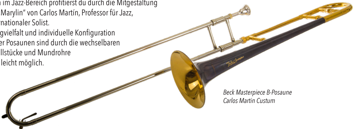
Beck Masterpiece B-Posaune Carlos Martin Custom

Klangvielfalt und individuelle Konfiguration dieser Posaunen sind durch die wechselbaren Schallstücke und Mundrohre sehr leicht möglich.