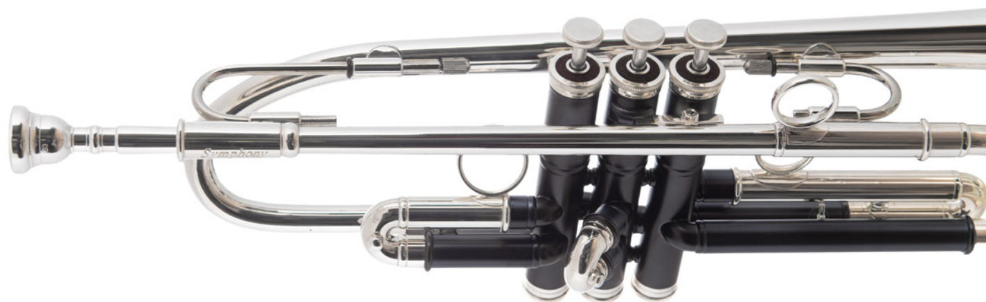
Fides U-Phonic FTR-8500MLBSBBG

Den Namen erhielt dieses Modell durch die u-förmigen verstell- und abnehmbaren Stützen und „Phonic“ steht für die immensen unterschiedlichen Soundvariationen, die die „U-Phonic“ in sich birgt.