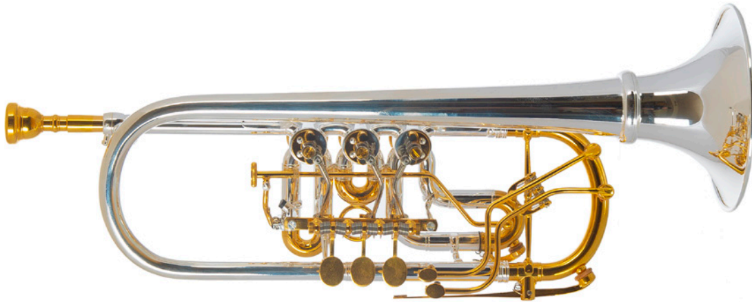
OPUS C PRO BTRK-9510WBS mit Doppelüberblasklappe, Wechselbecher und Teilvergoldung

Die Maschinenblöcke von Meinschmidt oder Zirnbauer sind frei wählbar. Diese unterscheiden sich trotz ähnlicher oder sogar derselben Bohrung im Anspielverhalten der Trompete.