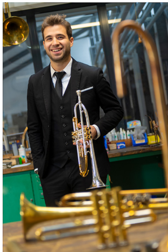
Rubén Simeó zu Besuch in der Dettinger Meisterwerkstatt. Foto links: B-Trompete Rubén Simeó Custom

„Rubén Simeó“ - Besonderer Künstler, besonderes Instrument. Das Custom Modell RS haben wir dem spanischen Ausnahmetrompeter auf den Leib geschneidert. Auch deine individuellen Wünsche sind bei uns herzlich willkommen. Durch eine Vielzahl an Mundrohren und einigen weiteren Kniffs und Tricks verwirklichen wir deine Ideen sehr gerne.