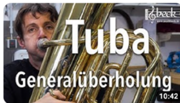
Tuba Generalüberholung 44.092 Aufrufe · vor 2 Jahren