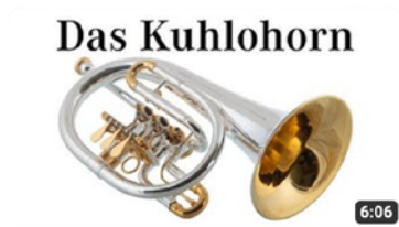
Das Kuhlohorn 62.171 Aufrufe · vor 3 Jahren