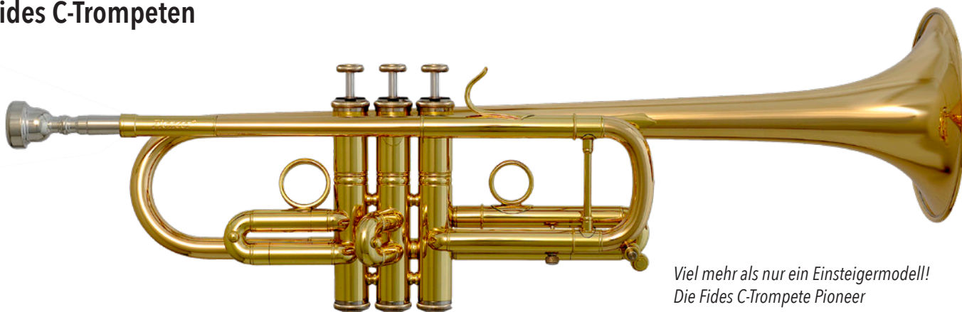
Viel mehr als nur ein Einsteigermodell! Die Fides C-Trompete Pioneer