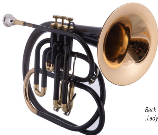
Beck Masterpiece Basstrompete „Lady Berta“

„Emil“, genauso mit einer 13mm Maschine versehen, leistet 3-ventilig, mit einem Trigger ausgestattet, der Lady Gesellschaft.