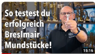
So testest du auch zu Hause erfolgreich Breslmair Mundstücke 1561 Aufrufe · vor 12 Tagen