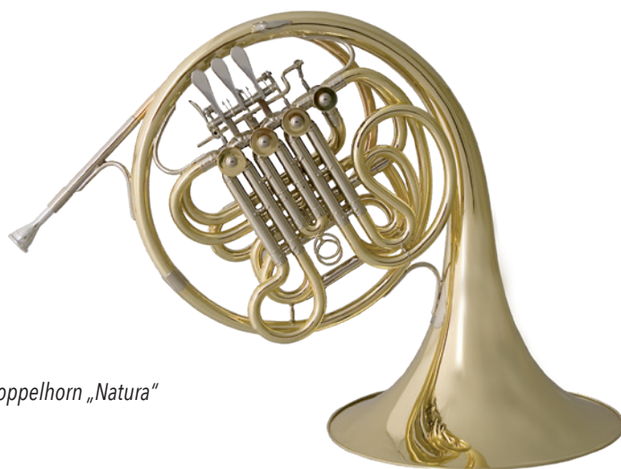
Beck Masterpiece Doppelhorn „Natura“ in Goldmessaing

Diese aufwändige Bauweise erlaubt uns ein optimales Platzieren der Maschinenposition. Dies wiederum verbessert das Anspracheverhalten vor allem bei der F-Horn-Lage.