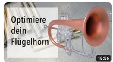
Optimiere dein Flügelhorn ANTWORTEN