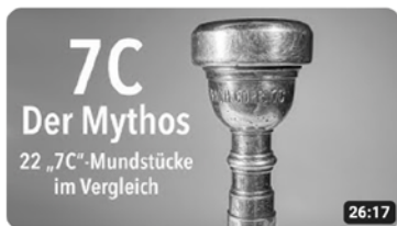
Trompetenmundstück 7C | Der Mythos | 22 "7C"-Mundstücke im Vergleich 24.339 Aufrufe · vor 1 Jahr