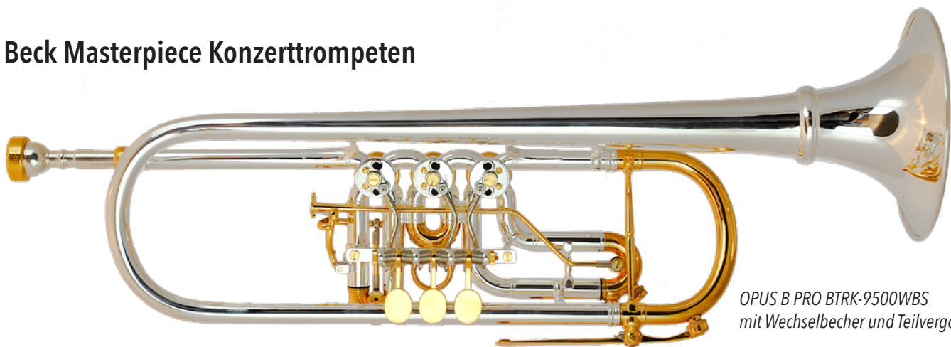
OPUS B PRO BTRK-9500WBS mit Wechselbecher und Teilvergoldung