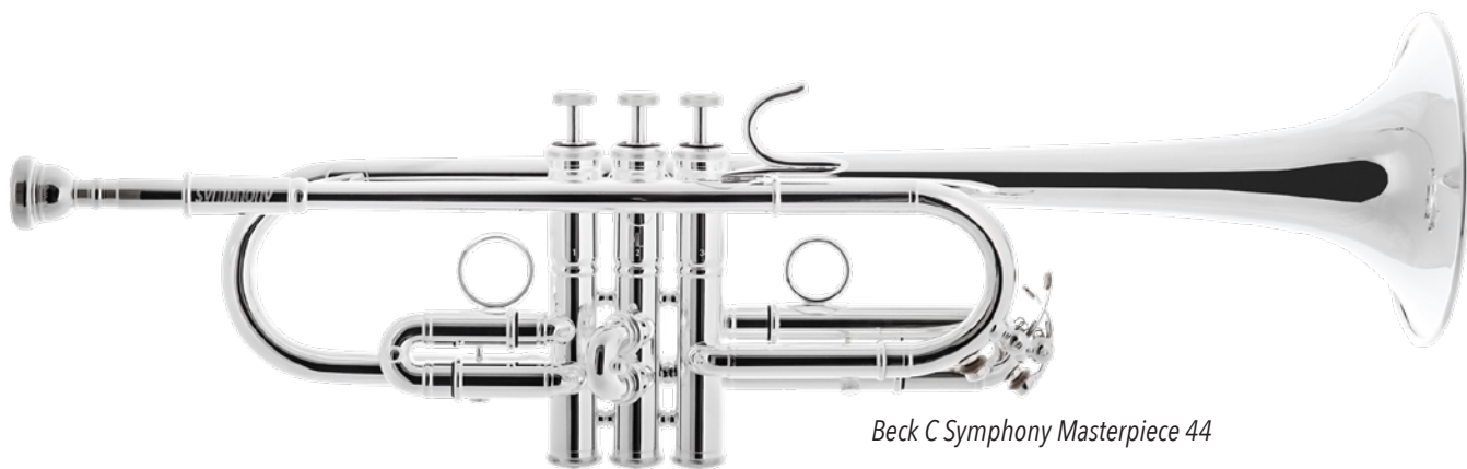
Beck C Symphony Masterpiece 44