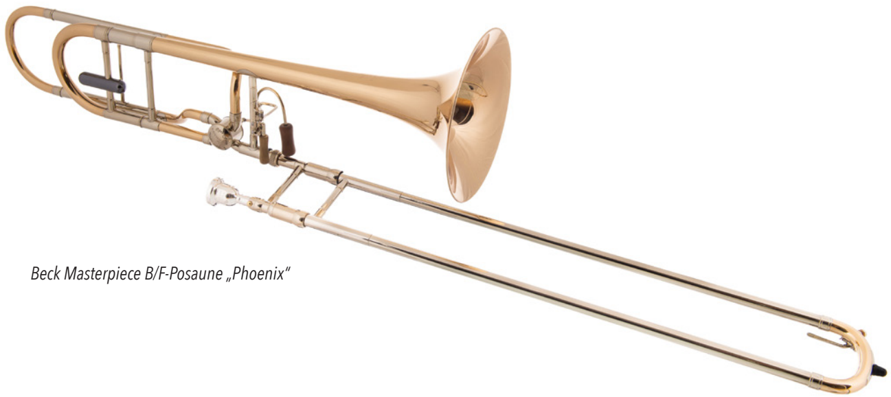
Beck Masterpiece B/F-Posaune „Phoenix“