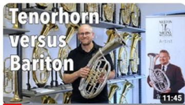
Tenorhorn versus Bariton | Wo liegen die Unterschiede? 52.421 Aufrufe · vor 1 Jahr