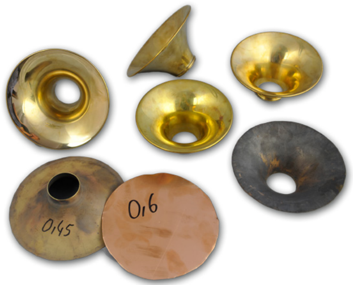
Wechselbecher für die Modelle OPUS PRO WB sind in unterschiedlichen Materialien, Größen und Wandstärken erhältlich

Auch individuelle Sonderwünsche verwirklichen wir gerne. Dies ist möglich, da wir natürlich auch die Schallstücke und Schallbecher in unserer eigenen Werkstatt fertigen.